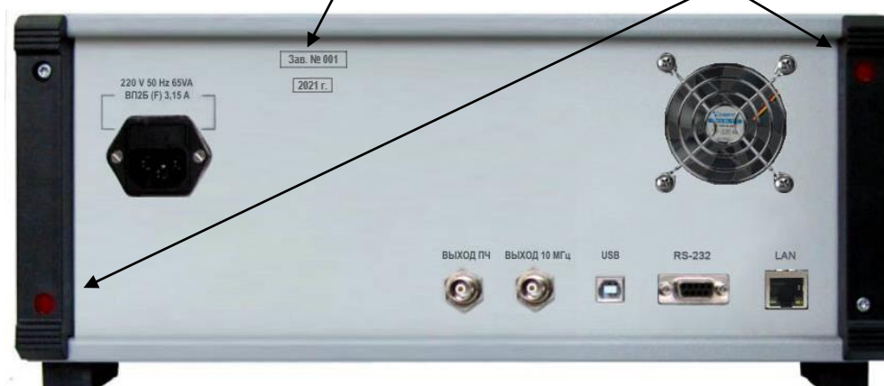
Рисунок 2 – Схема пломбировки от несанкционированного доступа, обозначение мест нанесения знака поверки

Места пломбировки с нанесением знака поверки